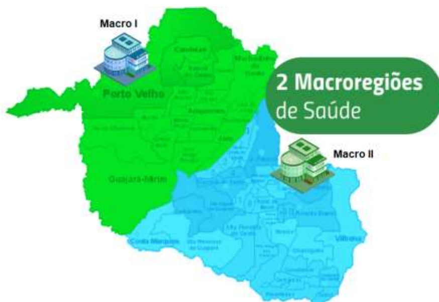
Macro Regiões Hospitalares